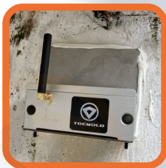
建筑物 自动化监测